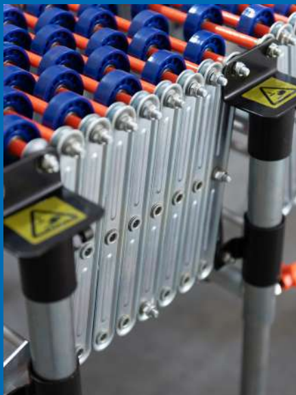
Estructura y ejes de acero inoxidable. Ruedas de ABS con rodamiento.

Los transportadores modulares extensibles ofrecen excelentes prestaciones para el movimiento de bultos sueltos. Su flexibilidad permite configurar el transportador de diferentes maneras, formando curvas de distintos tipos y peralte que habilitan el movimiento de los bultos solo por gravedad, sin necesidad de motorización.