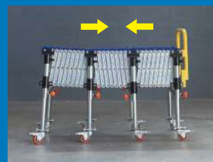
Un conjunto estándar se compone de 3 módulos El conjunto mide abierto 4,5m y cerrado 1m.