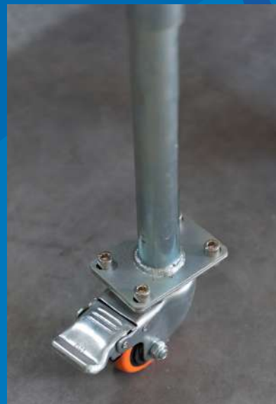
Patas con ruedas giratorias y freno.